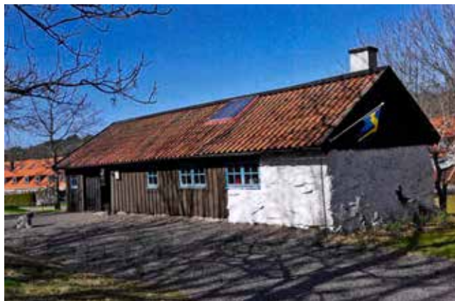
Den gamla smedjan som tillhör Askims Hembygdsförening.

En historisk miljö strax söder om Skövde. Sahlbergsstugan från 1700-talet står på sin ursprungliga plats, medan andra byggnader är hitflyttade.